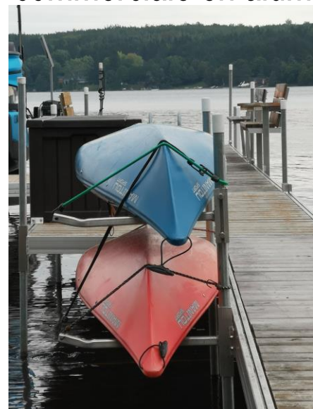
support à kayak double ou simple