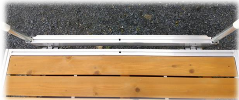
tube d'ancrage au bord avec pieux