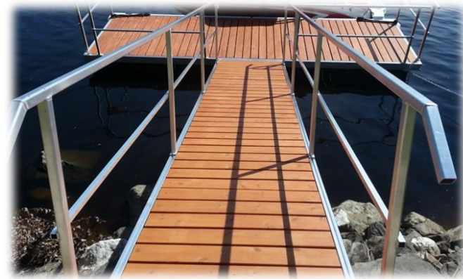
rampe en aluminium