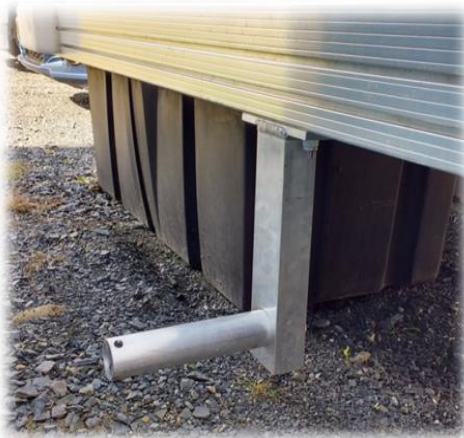
essieu roue de transport