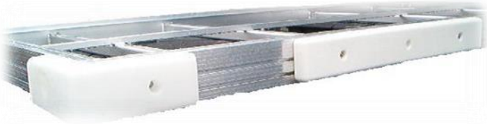
Coin pare-choc et pare-choc de 2' 3' et 4'