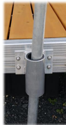
attache pieu coulissant