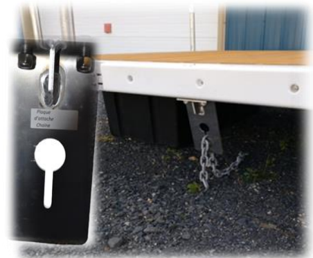
Plaque attache chaîne