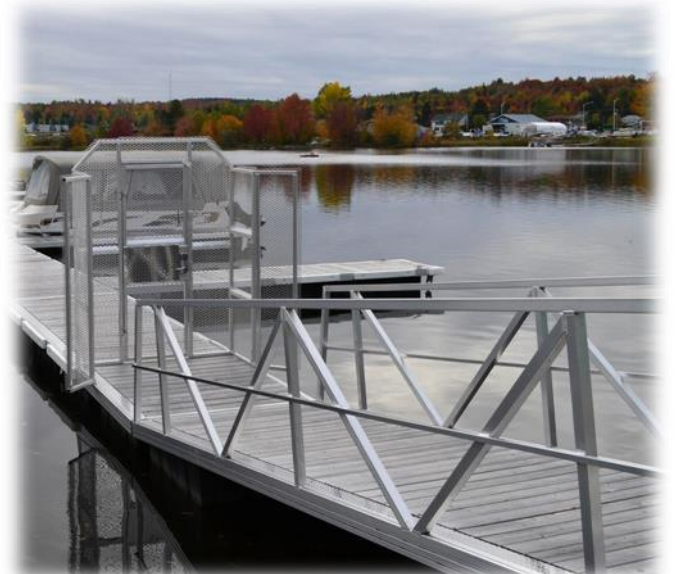
rampe commerciale en aluminium