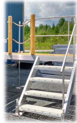
Escalier 3 ou 4 marches