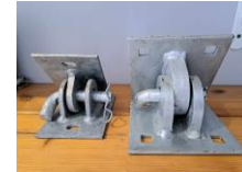
Penture en acier Galvanisé