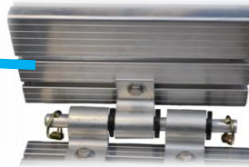
Penture boulonnée avec acétal