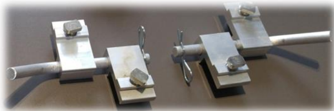
Penture bout à bout 4'' à 4''