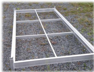
Quai standard bout en 4"