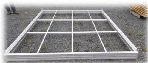
Quai Patio bout en 5 1/4"