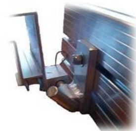
Penture bout à Patio 4'' à 5 1/4''