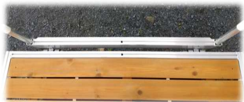
tube d'ancrage au bord avec pieux