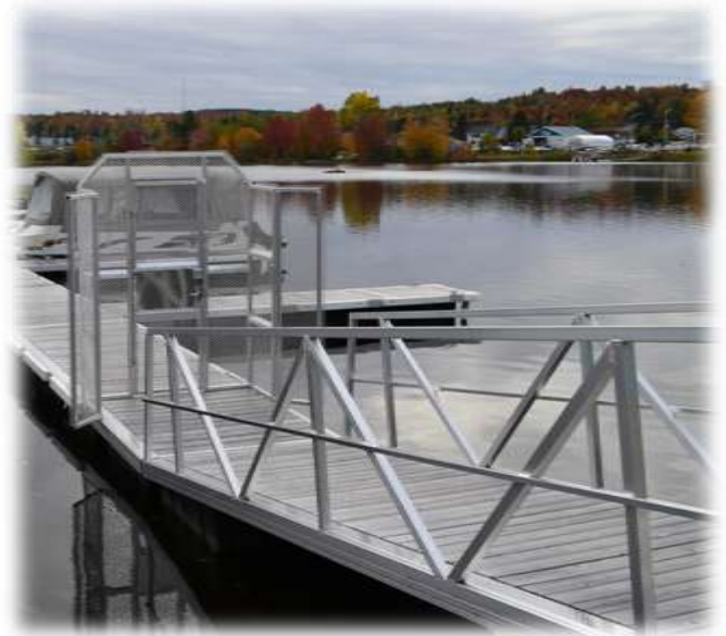
rampe commerciale en aluminium