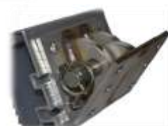
Penture en acier Galvanisé