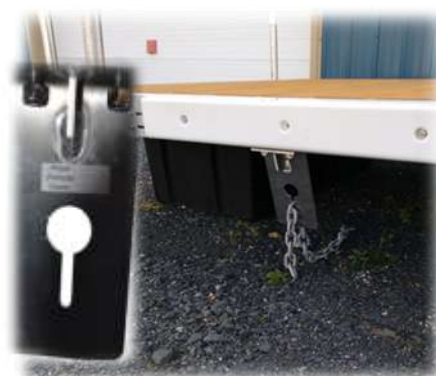
Plaque attache chaîne