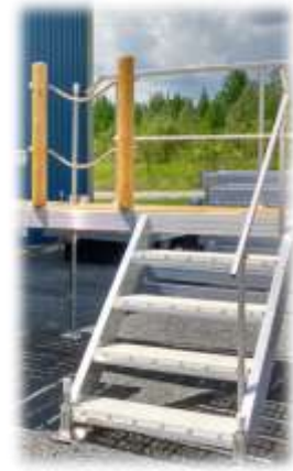
Escalier 3 ou 4 marches