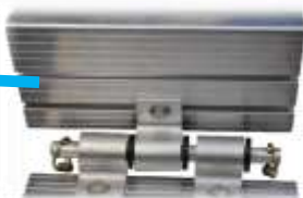
Penture boulonnée avec acétal