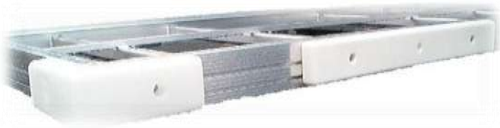
Coin pare-choc et pare-choc de 2' 3' et 4'