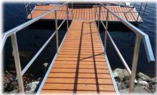
rampe en aluminium