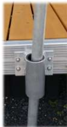
attache pieu coulissant