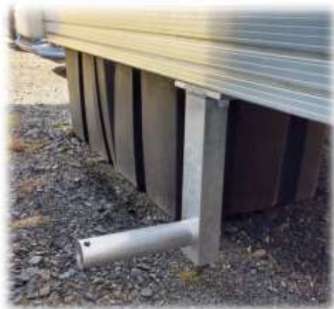
essieu roue de transport